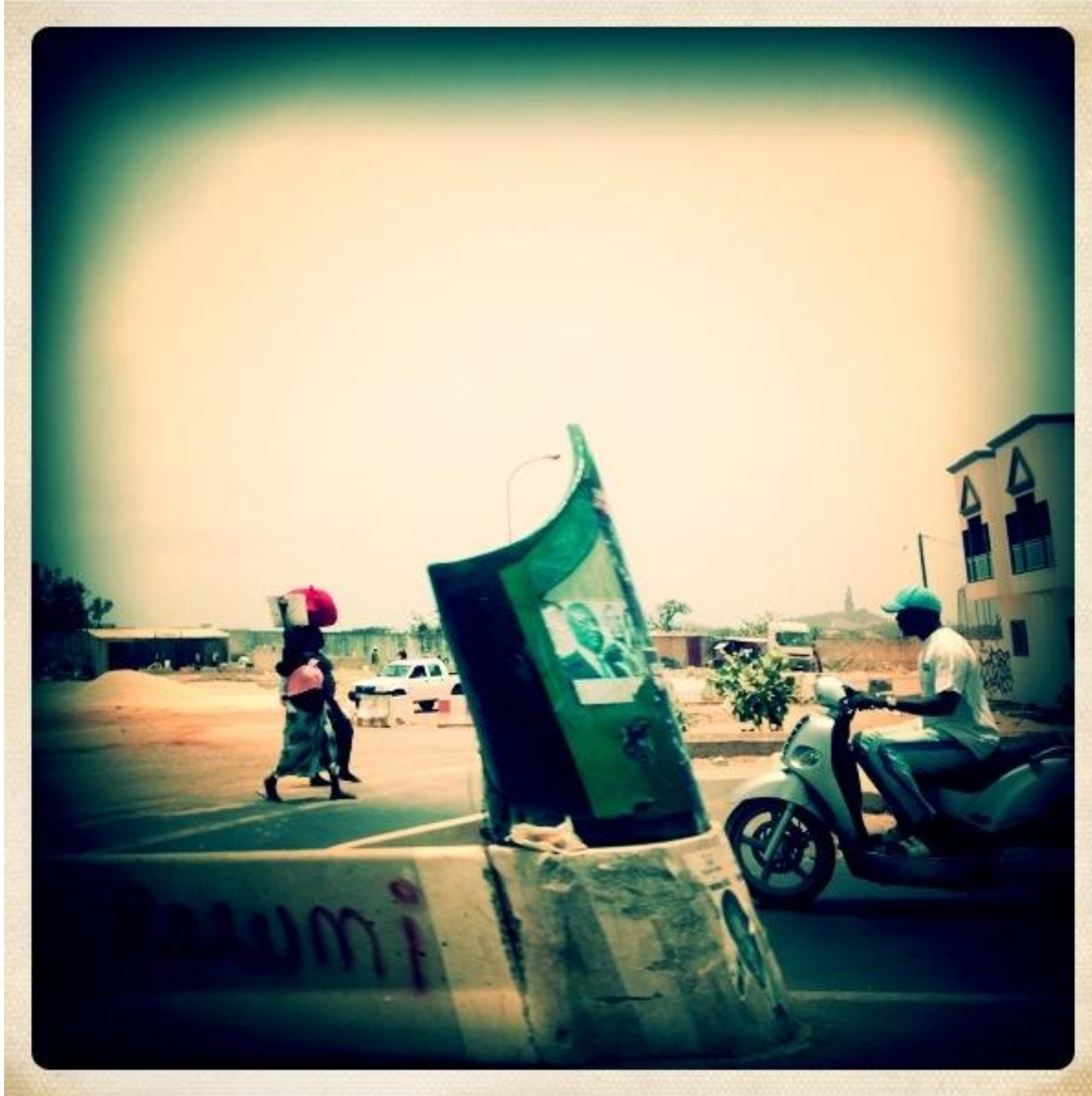
Dakar: trabalhadores autônomos em vias urbanas, reflexo da uberização.

A uberização descreve a gestão do trabalho por meio de algoritmos e plataformas digitais, transferindo os riscos do negócio para o trabalhador. Embora ofereça autonomia ilusória com flexibilidade de horário, o trabalhador está sujeito a metas algorítmicas rigorosas e baixas taxas. As empresas atuam como 'intermediadoras de tecnologia', eximindo-se de obrigações trabalhistas e gerando a ausência de vínculo . Isso leva a jornadas exaustivas para compensar a baixa remuneração e à falta de cobertura em caso de acidentes, impactando negativamente a saúde.