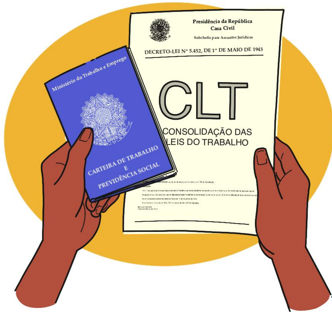
CLT e Carteira de Trabalho: símbolos de direitos trabalhistas no Brasil.

O trabalho é o pilar da organização social e econômica do Brasil, carregando cicatrizes históricas da transição do trabalho escravizado para o assalariado. O mercado é marcado pela dualidade entre o setor formal, com direitos garantidos, e um vasto setor informal. Hoje, as novas tecnologias e crises econômicas desafiam a percepção de 'ser trabalhador'.