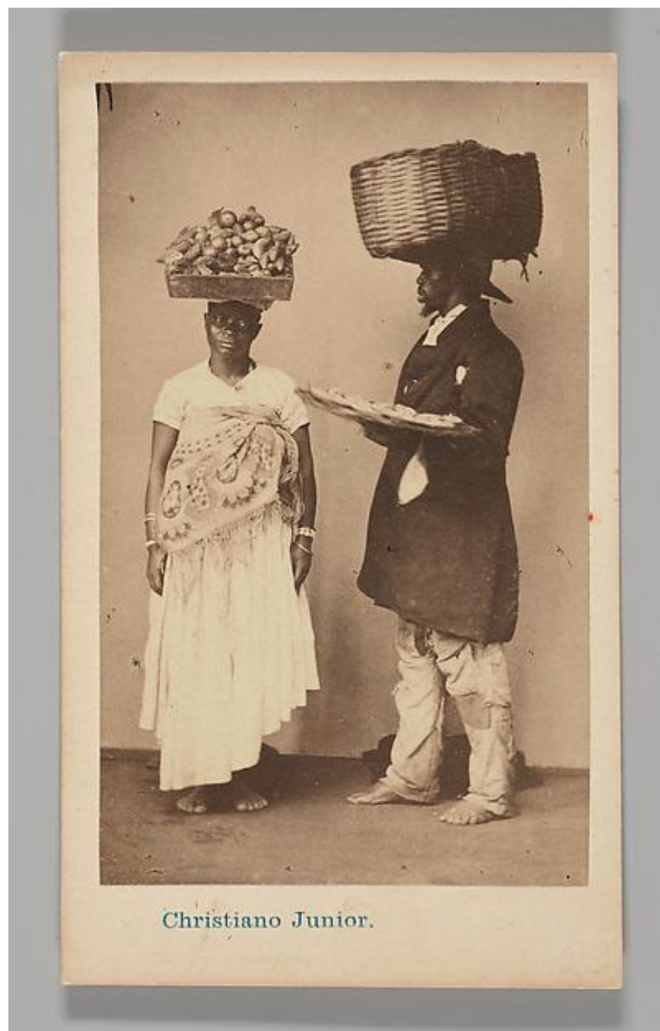
Vendedores ambulantes brasileiros: retrato da informalidade e subsistência.