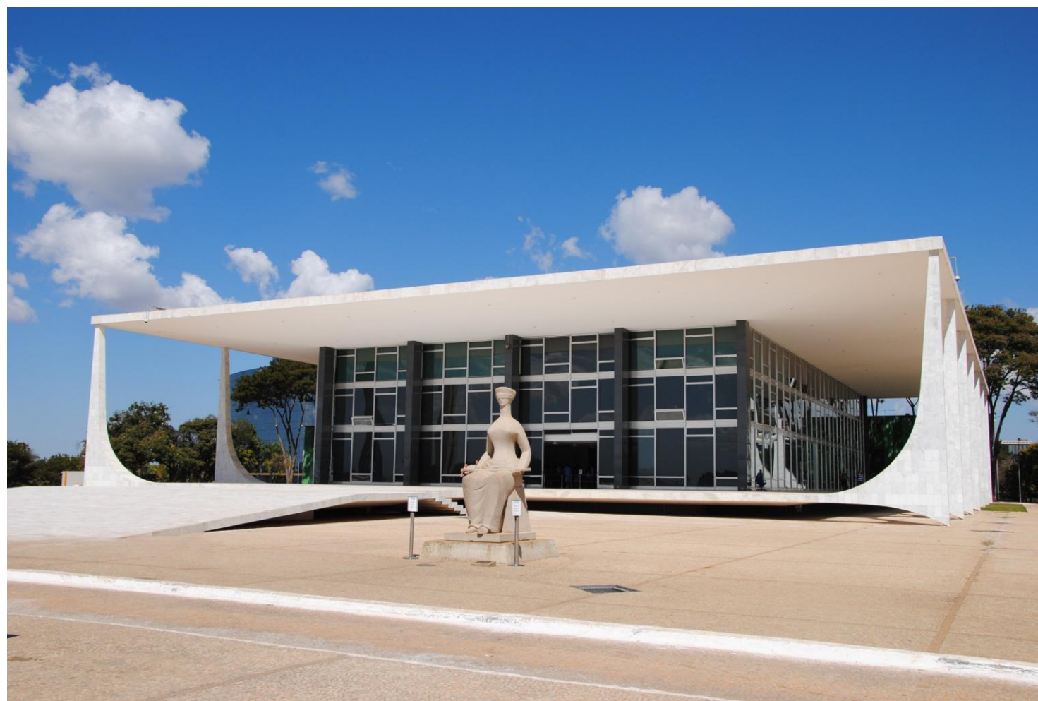
STF: Sede do Supremo Tribunal Federal, palco da decisão histórica.