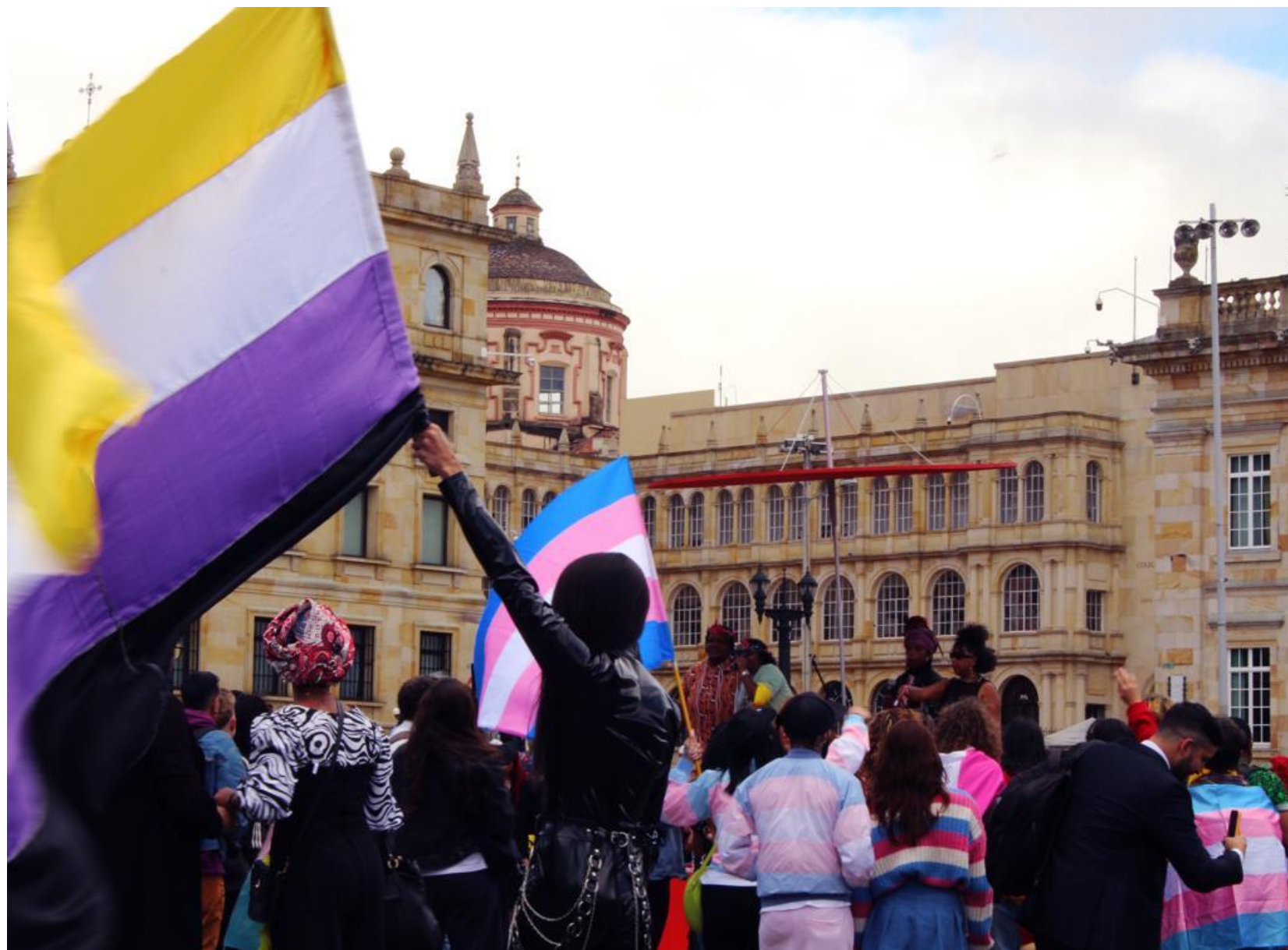
Protesto LGBTQIA+ em Bogotá: visibilidade e luta por direitos.