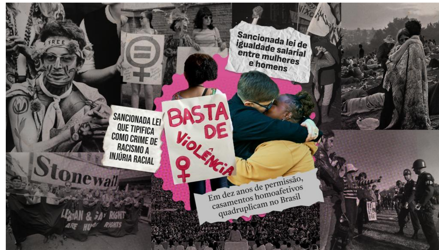
Stonewall: um marco na luta por direitos civis e cidadania

Em 28 de junho de 1969, a resistência à violência policial no bar Stonewall Inn, em Nova York, marcou uma virada. Este evento, que durou seis dias de confrontos, foi crucialmente liderado por mulheres trans e drag queens negras e latinas , como Marsha P. Johnson e Sylvia Rivera . Ele alterou o paradigma do movimento, passando da busca por 'aceitação' (movimento homófilo) para a reivindicação de 'libertação', inaugurando uma era de orgulho e visibilidade em substituição à discrição anterior.