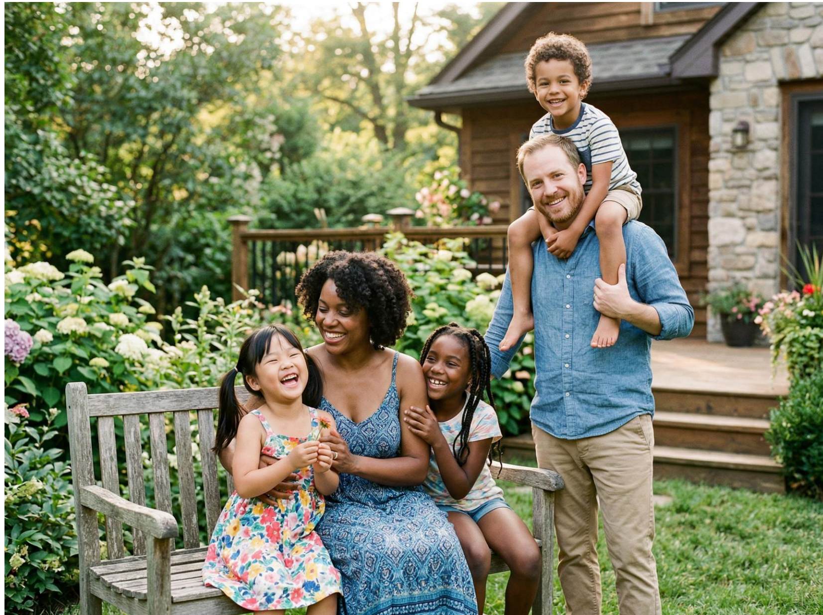
Famílias diversas: reconhecimento legal e direitos ampliados no Brasil.

Regulamentações do CFM asseguram acesso à reprodução assistida para pessoas LGBTQIA+, e são garantidos direitos sucessórios e de previdência para parceiros sobreviventes.