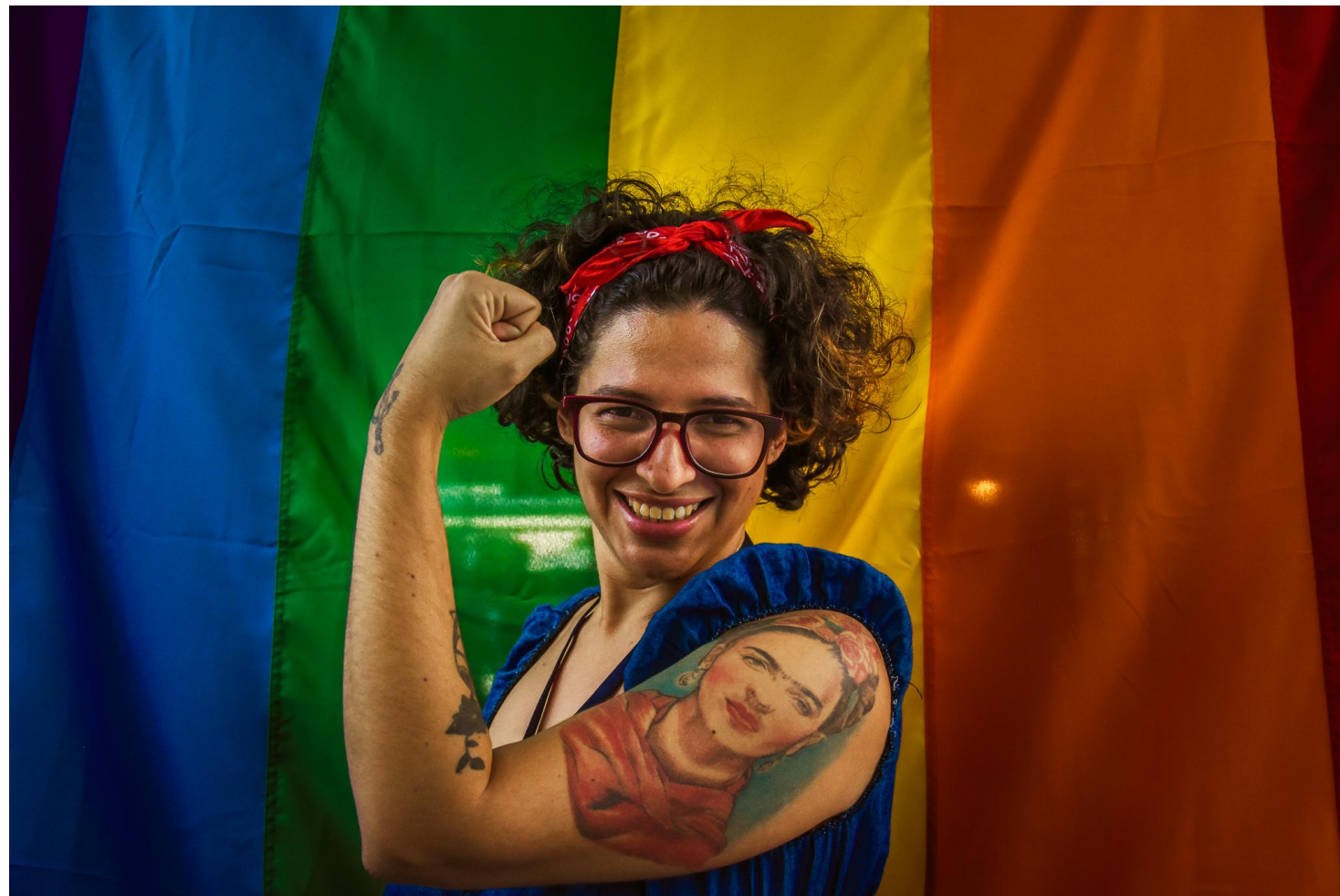
Ativista demonstra orgulho LGBTQIA+ em meio a dados alarmantes no Brasil.