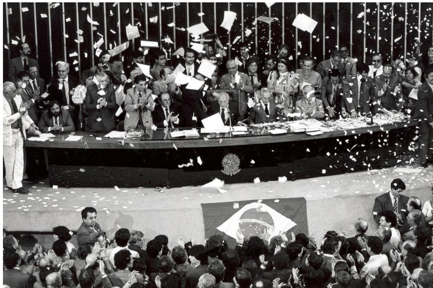
Promulgação da Constituição de 1988: esperança e luta por direitos.