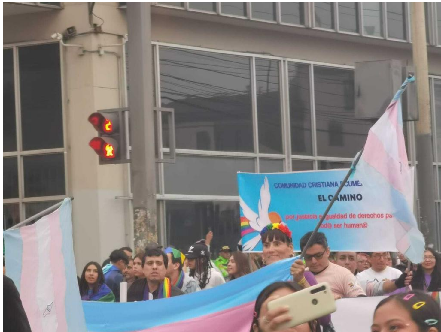
Cristãos marcham por direitos humanos e igualdade para a comunidade LGBTQIA+