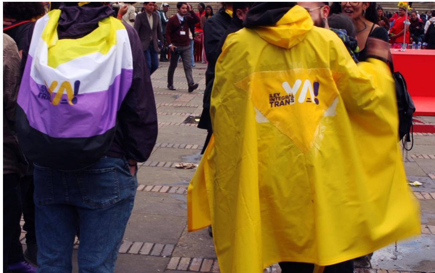
Manifestação pelos direitos trans na Colômbia: busca por cidadania plena.