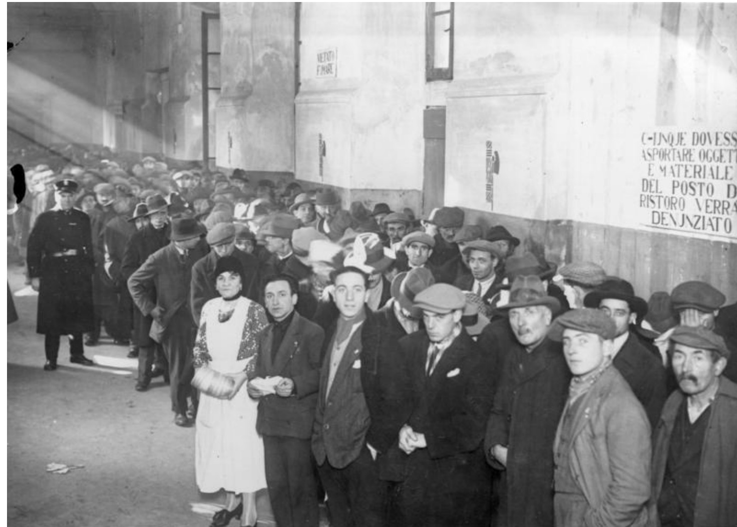
Desemprego na Itália: a Grande Depressão afetou a Europa