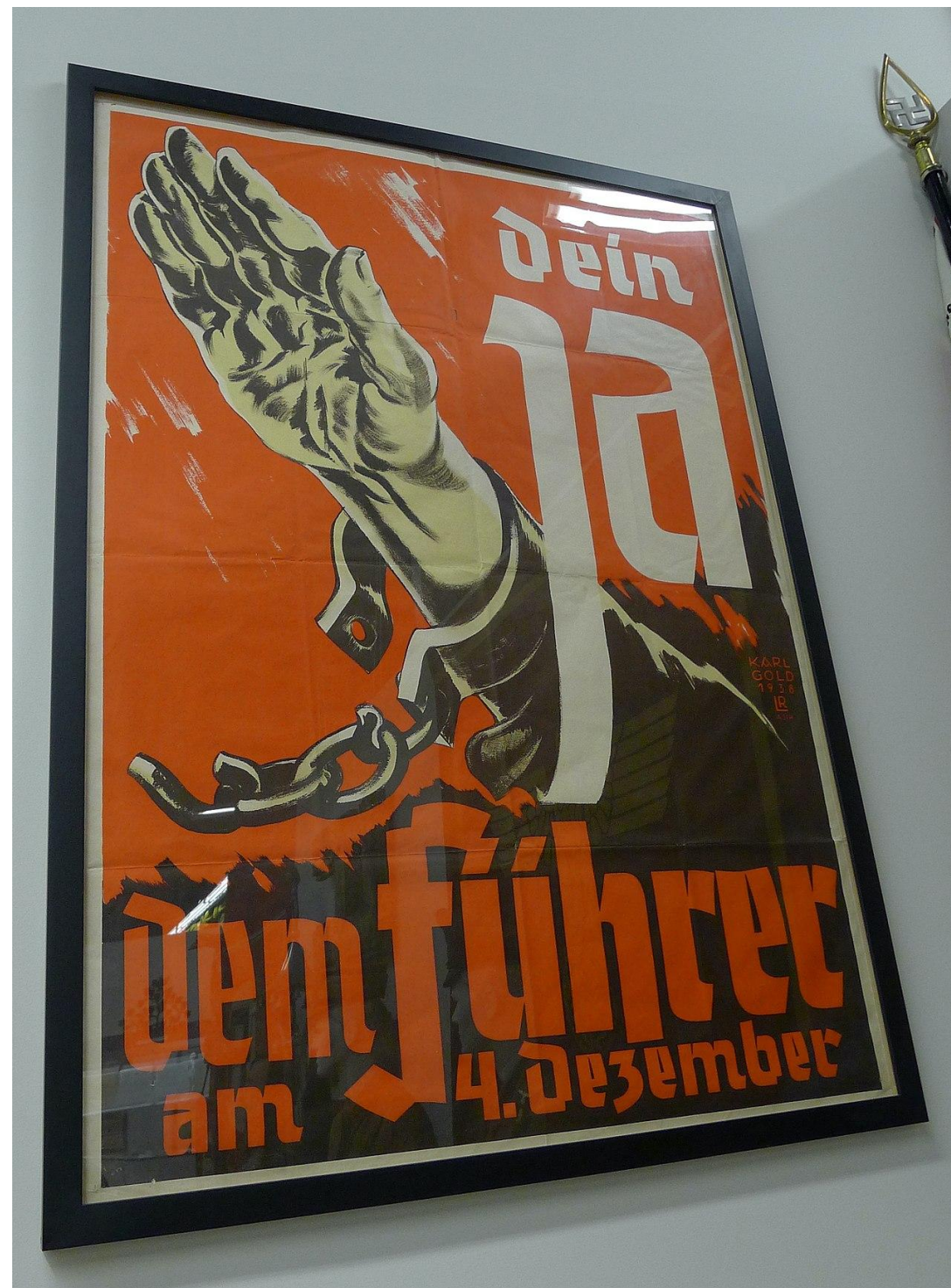
Propaganda nazista: culto ao líder e nacionalismo exacerbado.