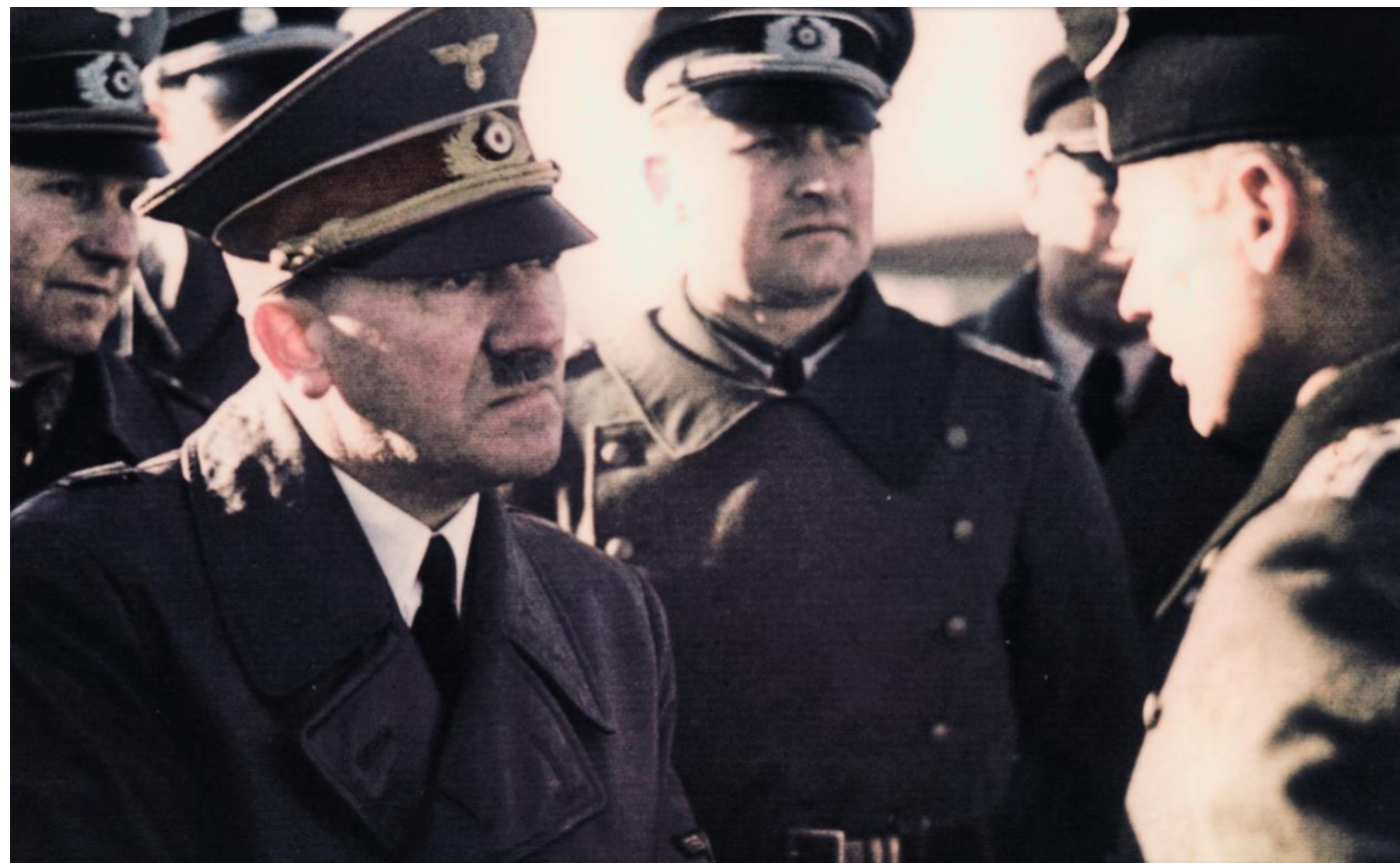
Hitler e oficiais: a ascensão do poder militar nazista.

Na Alemanha, a humilhação imposta pelo Tratado de Versalhes e o cenário de hiperinflação criaram um ambiente propício para o radicalismo. Adolf Hitler, líder do Partido Nazista (NSDAP), capitalizou esse descontentamento prometendo o cancelamento das dívidas de guerra e o restabelecimento da grandeza alemã. Após uma tentativa fracassada de golpe em 1923, conhecida como Putsch da Cervejaria, Hitler escreveu Mein Kampf na prisão, detalhando suas ideias centrais e planos futuros para a Alemanha.