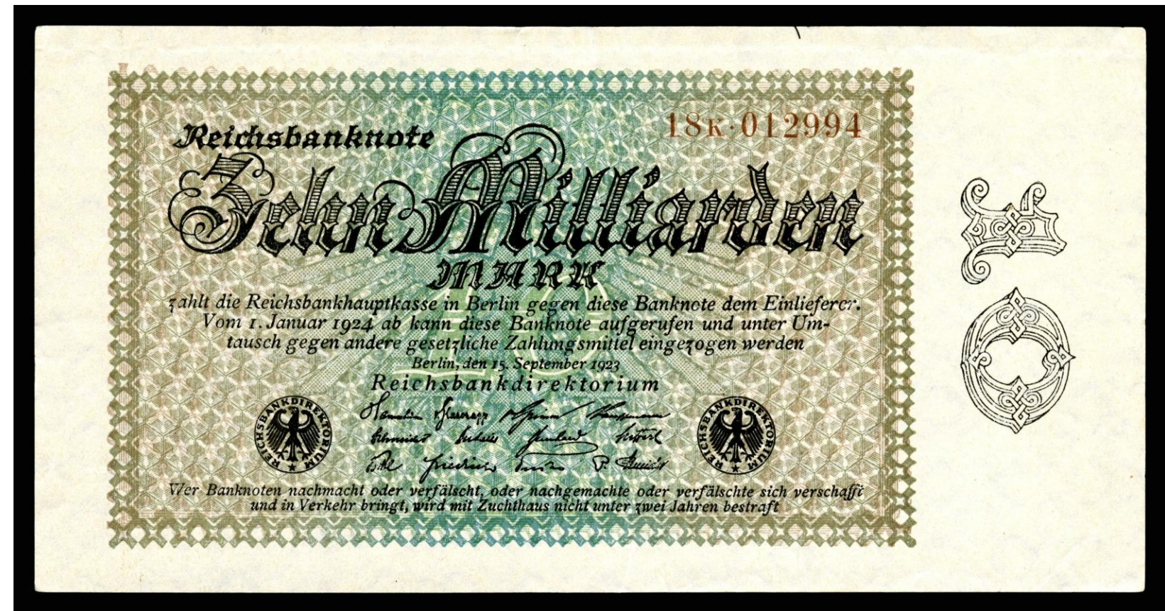
Nota de dez bilhões de marcos: símbolo da hiperinflação alemã.