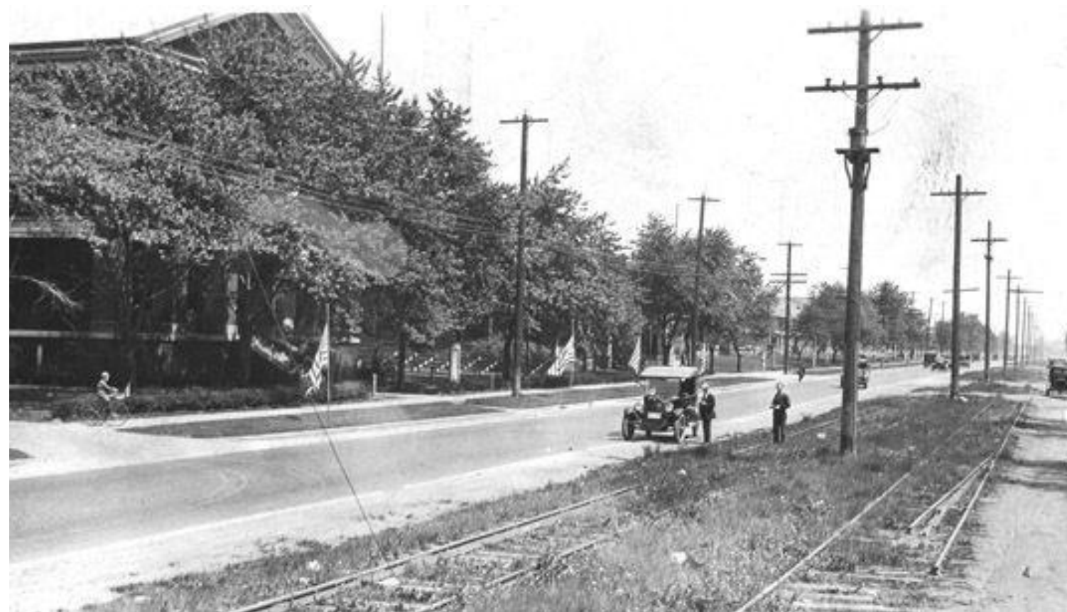
O Model T exemplifica o American Way of Life e o consumo em massa.

Após a Primeira Guerra Mundial, os Estados Unidos tornaram-se a maior potência econômica global, impulsionando o American Way of Life (estilo de vida de consumo em massa) com novos produtos tecnológicos. A adoção do fordismo e a produção industrial em larga escala geraram otimismo e um crescimento exponencial da bolsa de valores, atraindo milhares de investidores. Enquanto os EUA prosperavam, a Europa enfrentava grandes desafios de reconstrução e dívidas de guerra.