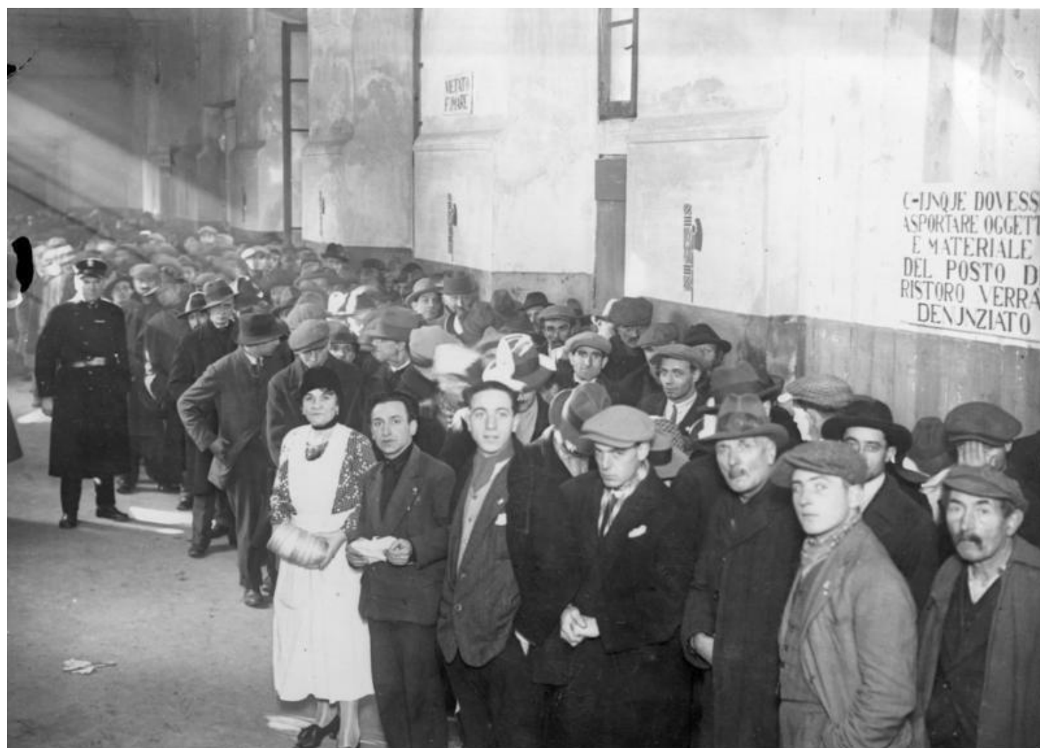
Desemprego na Itália: a Grande Depressão afetou a Europa