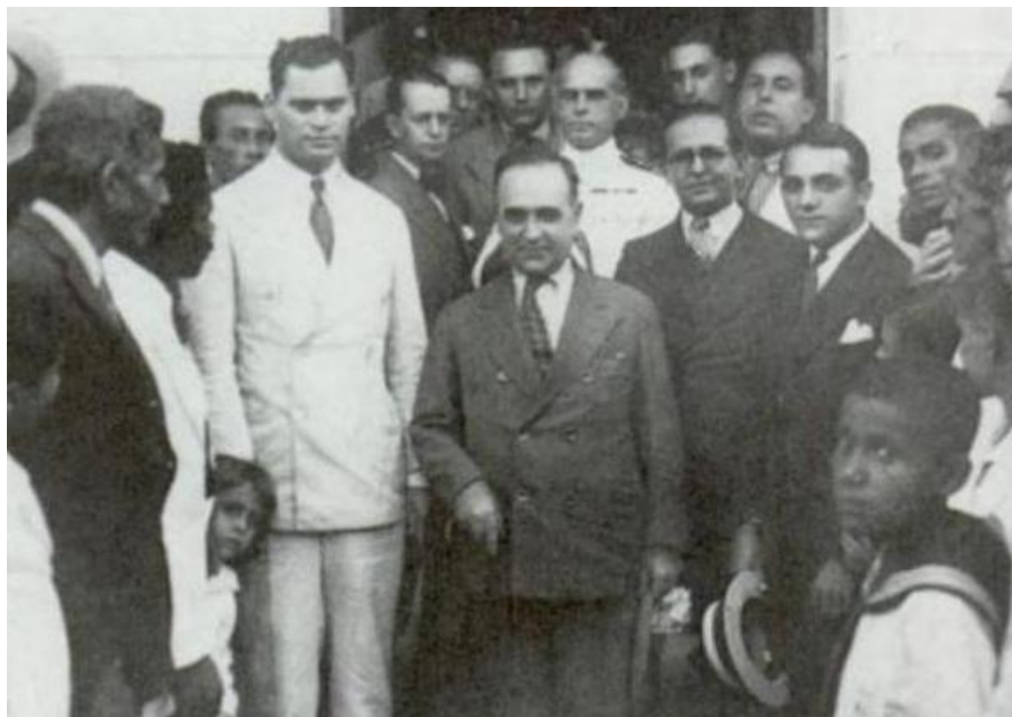
Getúlio Vargas e aliados: consolidação do poder no início da Era Vargas.