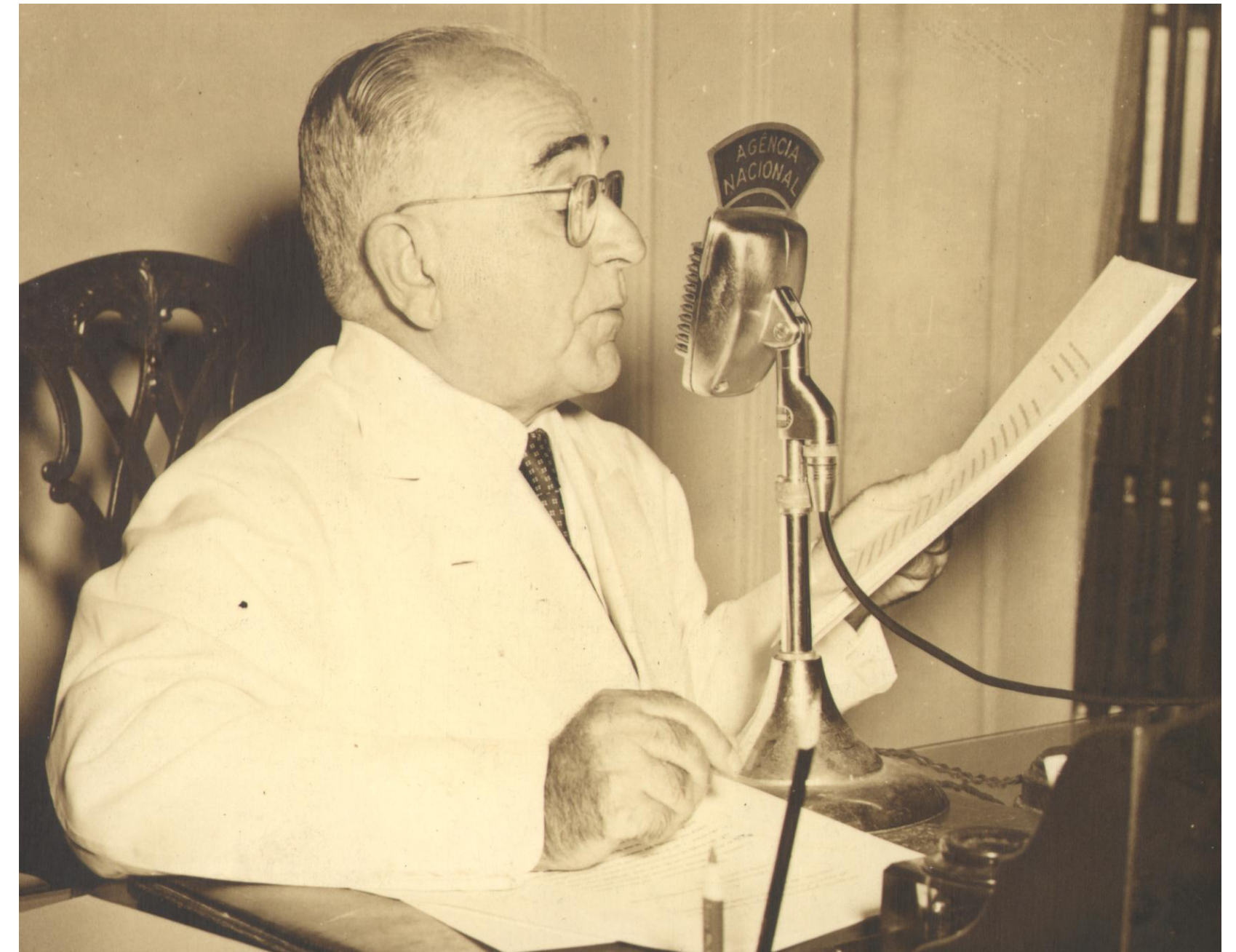
Vargas anuncia o Estado Novo pelo rádio em 1937.

Em 10 de novembro de 1937, Getúlio Vargas anunciou pelo rádio a instauração de uma nova ordem, culminando no fechamento do Congresso Nacional e no cancelamento das eleições de 1938. Assim nasceu o Estado Novo , uma ditadura autoritária e centralizadora que durou até 1945, inspirada em regimes corporativistas europeus, como os de Salazar e Mussolini.