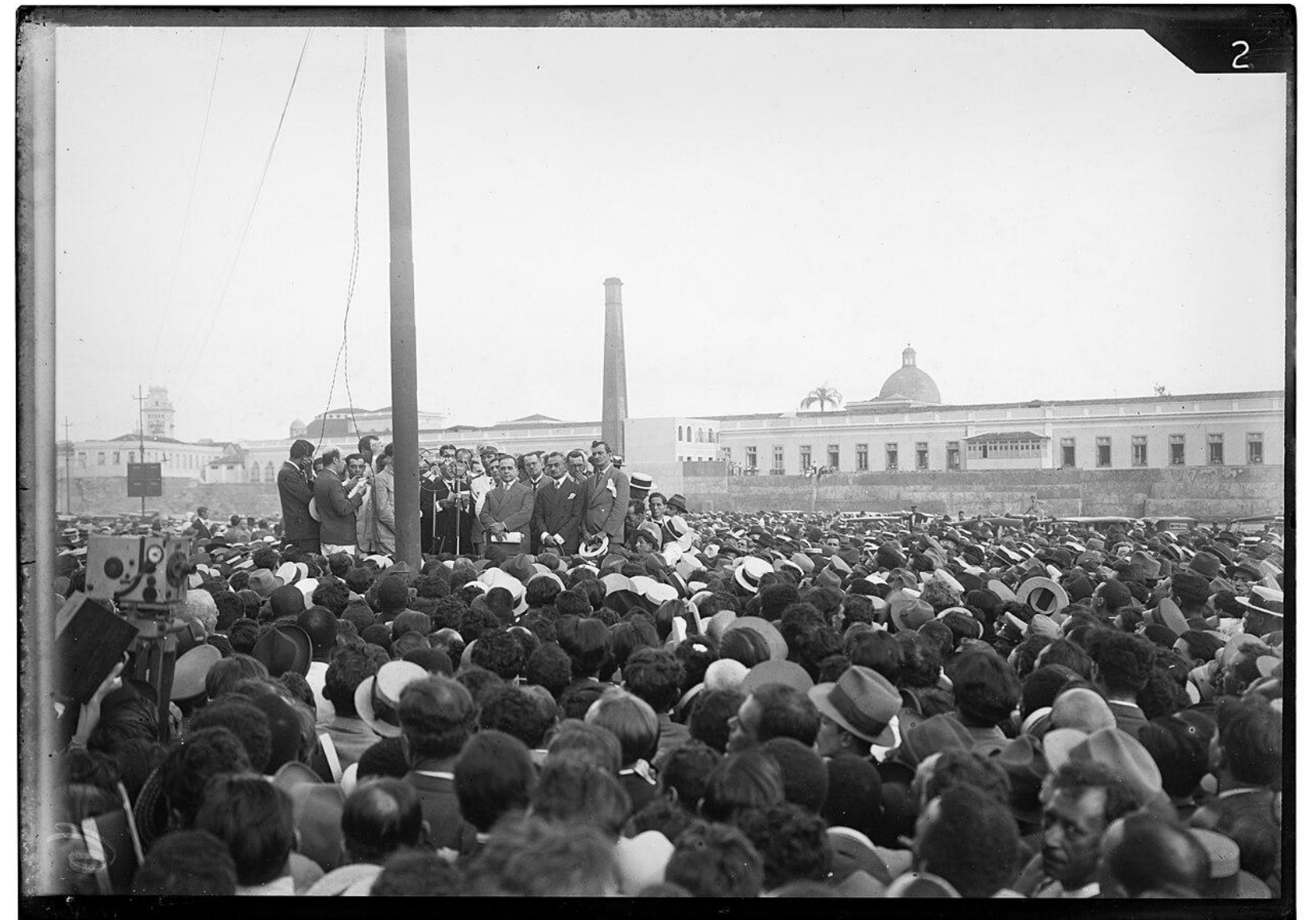
Vargas e a Aliança Liberal: o início de uma era política

Após a Revolução de 1930 e o Governo Provisório, o Brasil buscou a institucionalização política. A Assembleia Constituinte, convocada depois da Revolução Constitucionalista de 1932, promulgou a Constituição de 1934 . Getúlio Vargas foi eleito presidente de forma indireta pelos próprios constituintes para um mandato de quatro anos, iniciando a fase constitucional da Era Vargas, marcada por grande efervescência política.